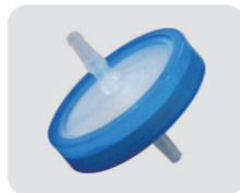
微生物高效过滤器