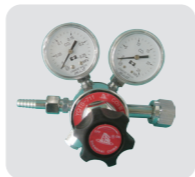
专用 CO 2 减压阀