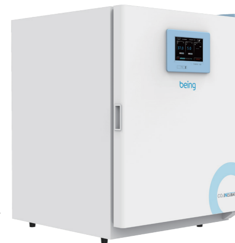
CO 2 培养箱 01